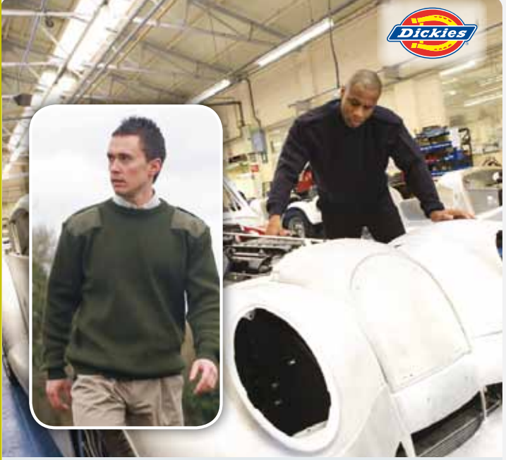
DK22100 | KN22100 Commando Crew Neck Worker Sweater 100% Acryl M, L, XL, XXL Dickies