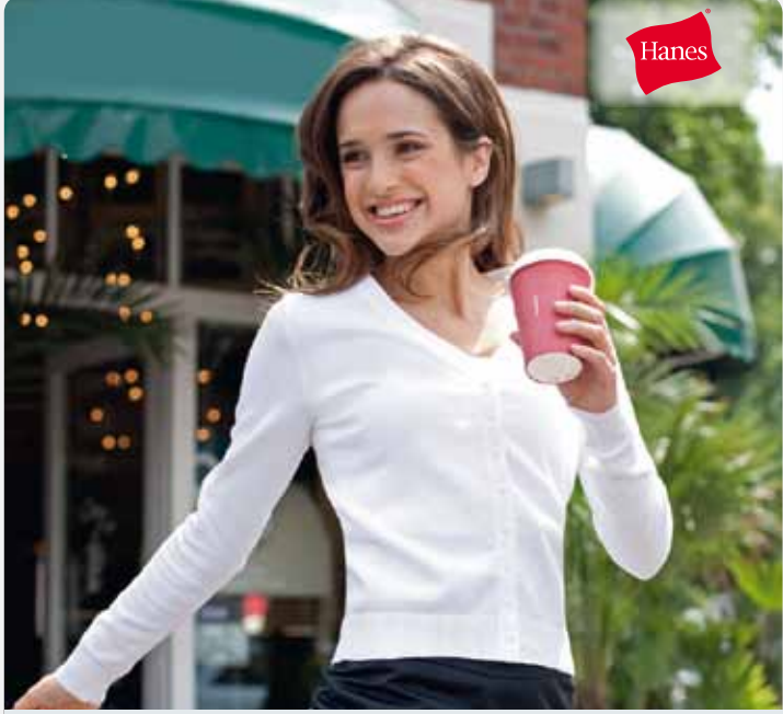
H492 | 6800 Ladies V-Neck Cardigan 86% gekämmte Ringspinn-Baumwolle/13% Polyamid/1% Elastan S, M, L, XL Hanes