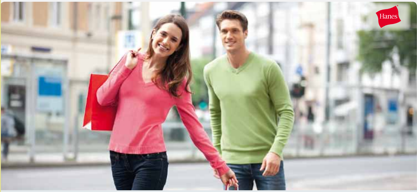
H490 | 6810 Ladies V-Neck Pullover 86% gekämmte Ringspinn-Baumwolle/13% Polyamid/1% Elastan S, M, L, XL Hanes